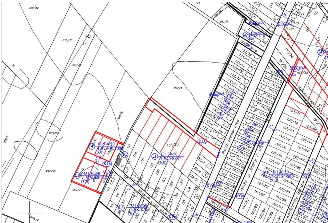
Kivonat a hatályos szabályozási tervből

A hatályos szabályozási terv a jelen módosítással érintett területek egy részét tervezett falusias lakóterületként, másik részét általános mezőgazdasági területként szerepelteti.