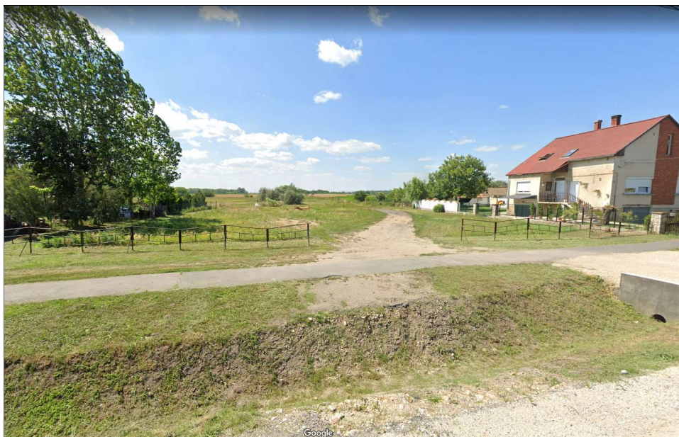
(a módosítással érintett terület a Petőfi Sándor utca felől)

A módosítással érintett területek közül, a jelenleg még külterületi telkek szántó 5, illetve legelő 3 besorolásúak.