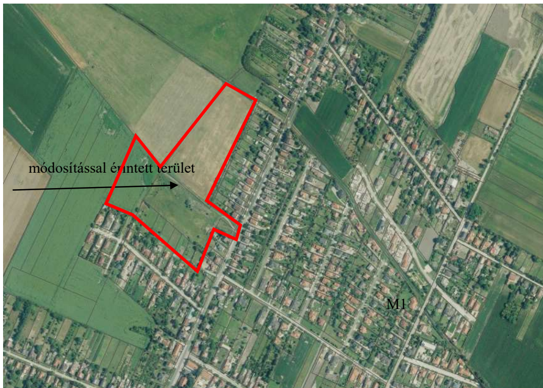
(módosítással érintett terület)

A község, településszerkezeti tervének, szabályozási tervének és helyi építési szabályzat módosítása annak érdekében, hogy a jelölt területek falusias lakóterület területfelhasználási kategóriába kerüljenek, és falusias lakóövezetként legyenek szabályozva.